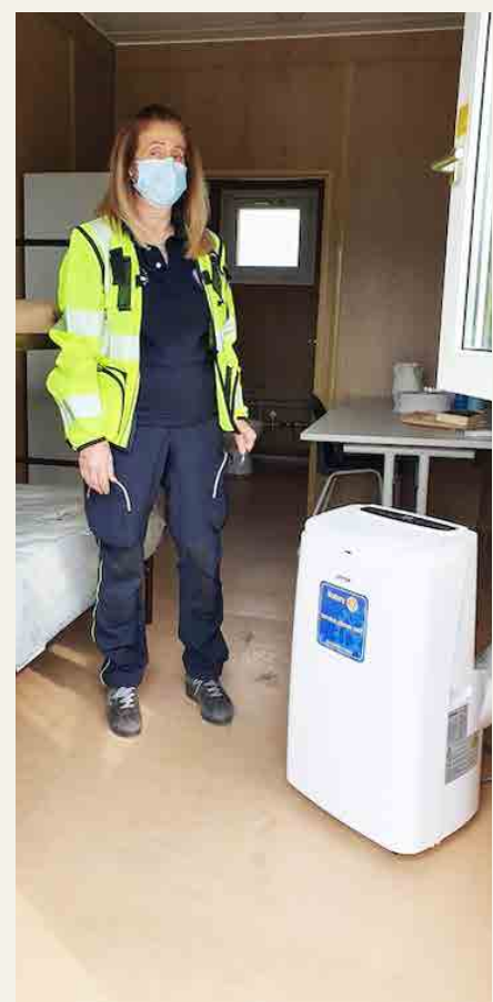
Uno dei condizionatori messi a disposizione dai Club fiorentini